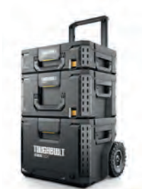
STARTSETT SYSTEM- KASSER STACKTECH 3 DELER

Nobb nr: 60672777 El-nr: 8818031 Art. Nr.: TB-B1S3-B-70R