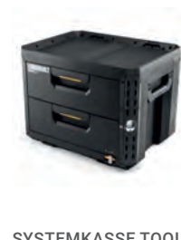
SYSTEMKASSE TOOL BOX STACKTECH LÅS XL 2 SKUFF

Nobb nr: 60805898 El-nr: 8818090 Art. Nr.: TB-B1-D-71