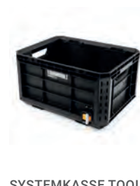
SYSTEMKASSE TOOL BOX STACKTECH ÅPEN

Nobb nr: 60672780 El-nr: 8818034 Art. Nr.: TB-B1-B-60C