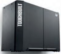
VERKSTEDINNREDNING OVERSKAP 2 DØRER 70 CM