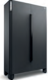
VERKSTEDINNREDNING HØYSKAP 2 DØRER 120 CM