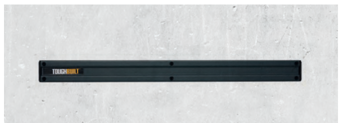
Skinne Veggfeste ClipTech HUB 60 Cm

Nobb nr: 60644337 Vekt (sett): ca. 0,2 kg El-nr: 88 180 13 Dimensjoner: ca. 14 × 8 × 5 cm