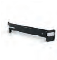
BØYLE CLIPTECH FOR STACKTECH

Nobb nr: 60672787 El-nr: 8818041 Art. Nr.: TB-B1-A-10