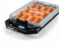
SORTIMENTSSKRIN STACKTECH LAV COMPACT

Nobb nr: 60672782 El-nr: 8818036 Art. Nr.: TB-B1-O-10