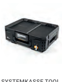
SYSTEMKASSE TOOL BOX STACKTECH

Nobb nr: 60805903 El-nr: 8818095 Art. Nr.: TB-B1-D-R92