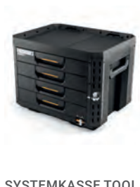
SYSTEMKASSE TOOL BOX STACKTECH LÅS XL 4 SKUFF

Nobb nr: 60805900 El-nr: 8818092 Art. Nr.: TB-B1-D-73