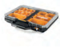
SORTIMENTSSKRIN STACKTECH LAV

Nobb nr: 60672783 El-nr: 8818037 Art. Nr.: TB-B1-O-30