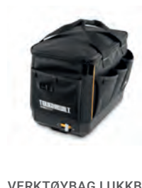
VERKTØYBAG LUKKBAR STACKTECH

Nobb nr: 60805901 El-nr: 8818093 Art. Nr.: TB-B1-D-74