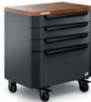
VERKSTEDINNREDNING BENKESKAP 4 SKUFFER 70 CM