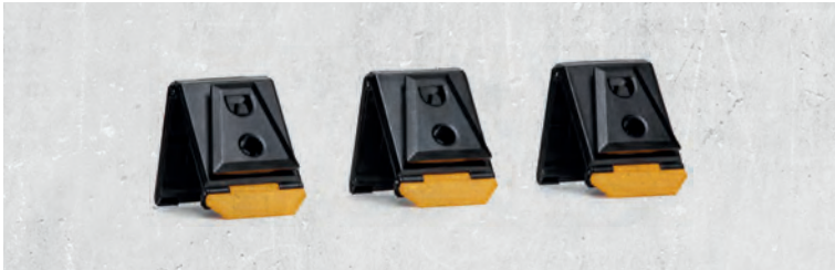
Utstyrfeste ClipTech HUB Belt/Vegg 3 Stk

ORGANISER VERKTØYENE SMARTERE MED HUB, HAMMERHOLDERE OG TILBEHØR.