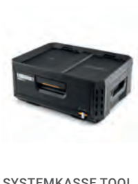
SYSTEMKASSE TOOL BOX STACKTECH 1 SKUFF

Nobb nr: 60672786 El-nr: 8818040 Art. Nr.: TB-B1-X-50