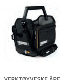
VERKTØYVESKE ÅPEN STACKTECH

Nobb nr: 60805904 El-nr: 8818096 Art. Nr.: TB-B1-S-60C