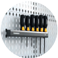
VERKSTEDINNREDNING SKRUTREKKER OPP- HENG