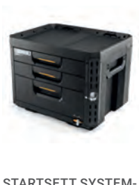
STARTSETT SYSTEM- KASSER STACKTECH 3 DELER

Nobb nr: 60805899 El-nr: 8818091 Art. Nr.: TB-B1-D-72