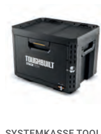
SYSTEMKASSE TOOL BOX STACKTECH LÅS XL 1 SKUFF

Nobb nr: 60672788 El-nr: 8818042 Art. Nr.: TB-B1-D-70-3