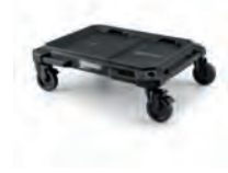
TRALLE STACKTECH 4 HJUL

Nobb nr: 60672779 El-nr: 8818033 Art. Nr.: TB-B1-O-10C