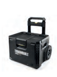
SYSTEMKASSE TOOL BOX STACKTECH MED HJUL

Nobb nr: 60672777 El-nr: 8818031 Art. Nr.: TB-B1S3-B-70R