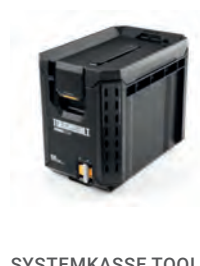
SYSTEMKASSE TOOL BOX STACKTECH COMPACT

Nobb nr: 60672781 El-nr: 8818035 Art. Nr.: TB-B1-B-50