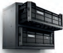
VERKSTEDINNREDNING OVERSKAP BAKKER 70 CM