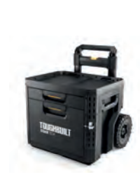
SYSTEMKASSE TOOL BOX STACKTECH LÅS OG HJUL 2 SKUFF

Nobb nr: 60805902 El-nr: 8818094 Art. Nr.: TB-B1-D-R91