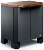
VERKSTEDINNREDNING BENKESKAP 2 DØRER 70 CM