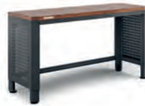
VERKSTEDINNREDNING ARBEIDSBENK 140 CM