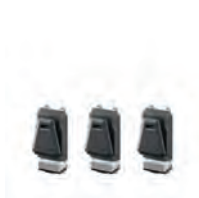
UTSTYRFESTE CLIPTECH HUB FOR STACKTECH 3 STK

Nobb nr: 60672792 El-nr: 8818046 Art. Nr.: TB-B1-A-32