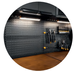
VERKSTEDINNREDNING VERKTØYPANEL 30 X 70 CM