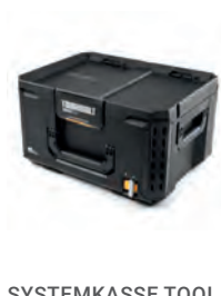
SYSTEMKASSE TOOL BOX STACKTECH LARGE

Nobb nr: 60672785 El-nr: 8818039 Art. Nr.: TB-B1-B-30