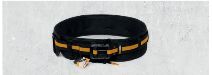
Verktøybelte Polstret Med Kraftig Spenne

Nobb nr: 60644334 Vekt (sett): ca. 0,3–0,4 kg total El-nr: 88 180 09 Antall: 3 stk i settet