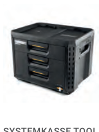
SYSTEMKASSE TOOL BOX STACKTECH 3 SKUFFER

Nobb nr: 60672775 El-nr: 8818029 Art. Nr.: TB-B1-D-30-1