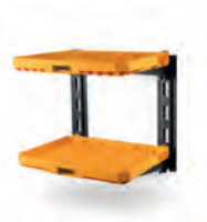
HYLLESYSTEM STACK- TECH 2 HYLLER

Nobb nr: 60672778 El-nr: 8818032 Art. Nr.: TB-B1-T-10