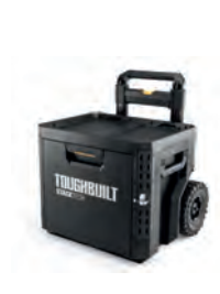
SYSTEMKASSE TOOL BOX STACKTECH LÅS OG HJUL 1 SKUFF

Nobb nr: 60672784 El-nr: 8818038 Art. Nr.: TB-B1-B-70R